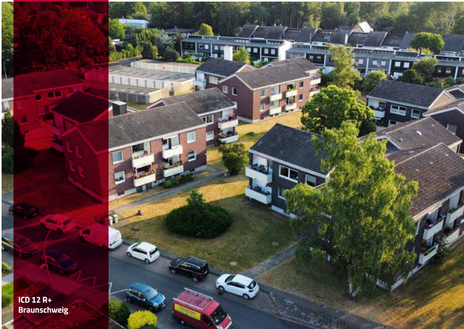
ICD 12 R+ Braunschweig