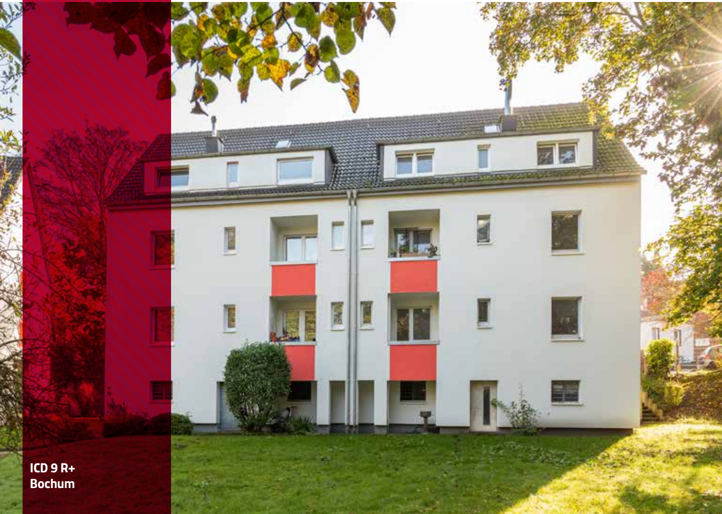
ICD 9 R+ Bochum