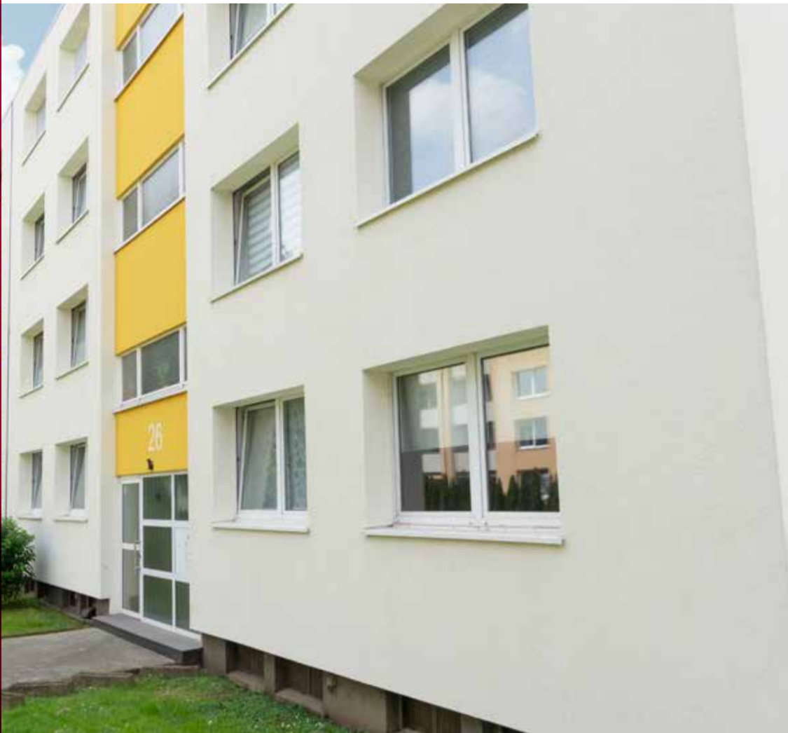
ICD 10 R+ Neukirchen-Vluyn