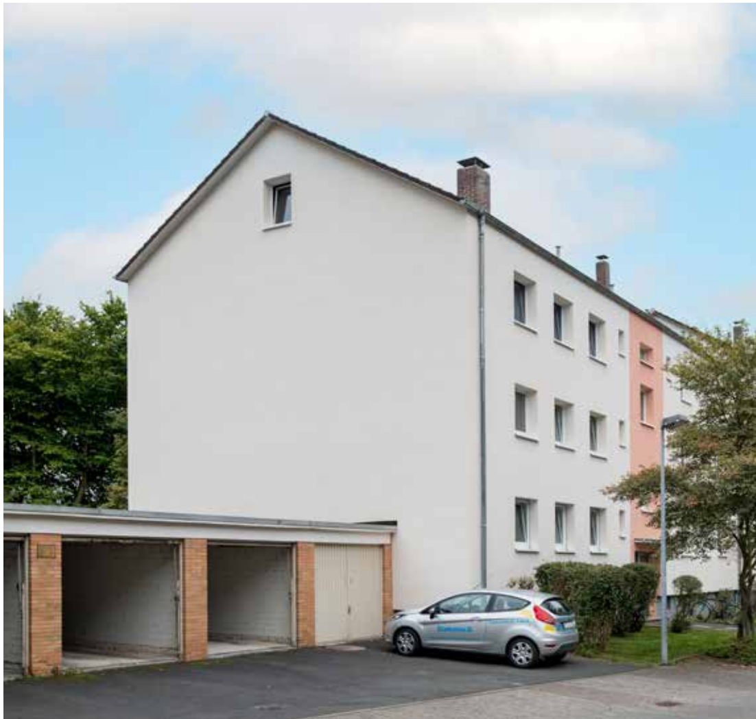
ICD 5 R+ Marburg