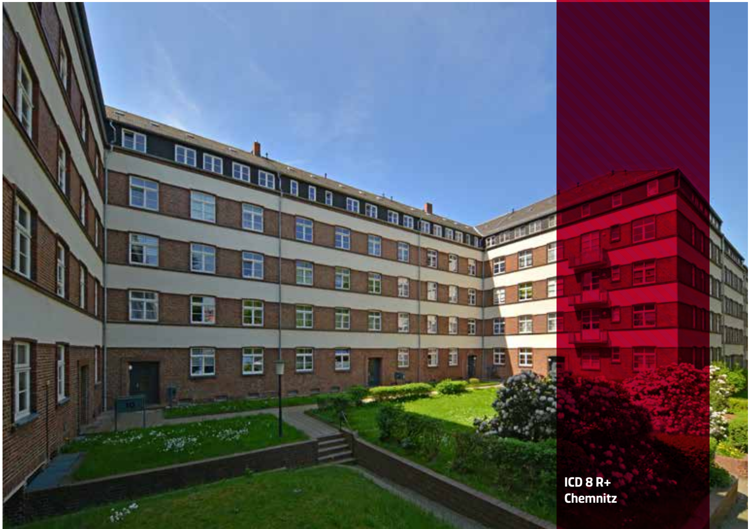
ICD 8 R+ Chemnitz