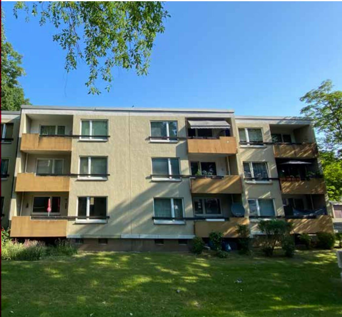
ICD 10 R+ Dortmund