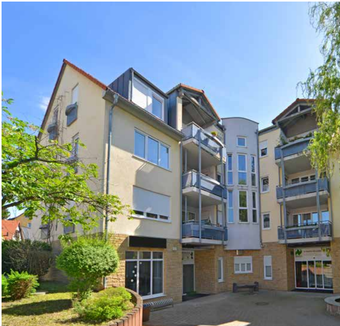
ICD 8 R+ Alsbach-Hähnlein