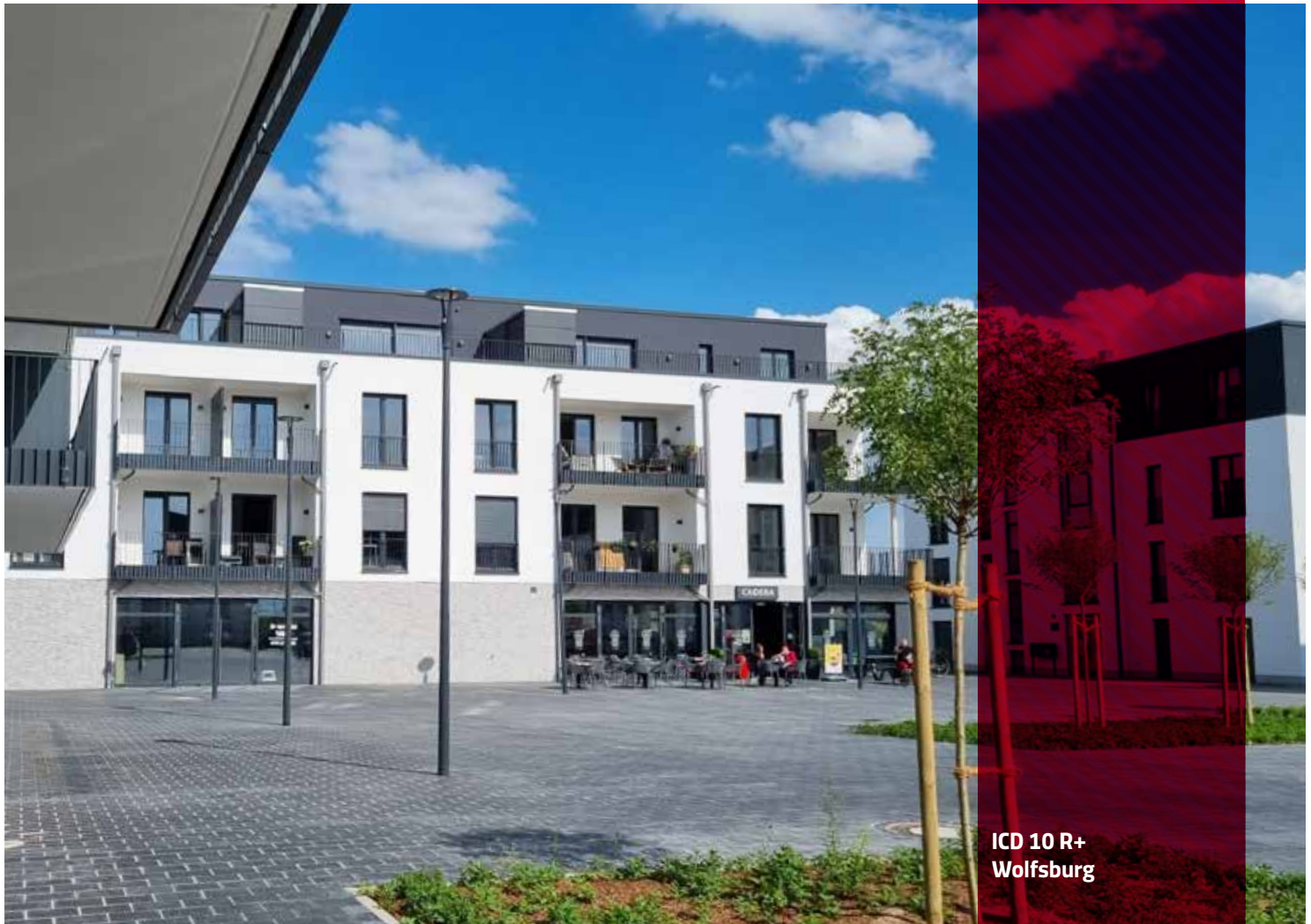
ICD 10 R+ Wolfsburg