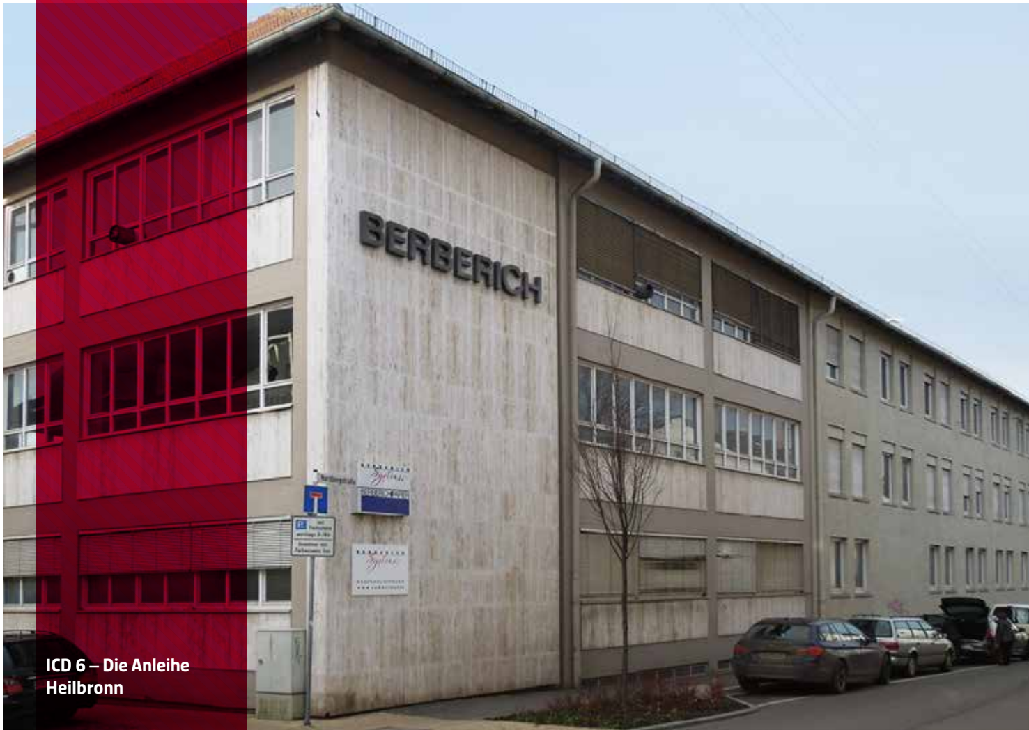
ICD 6 – Die Anleihe Heilbronn