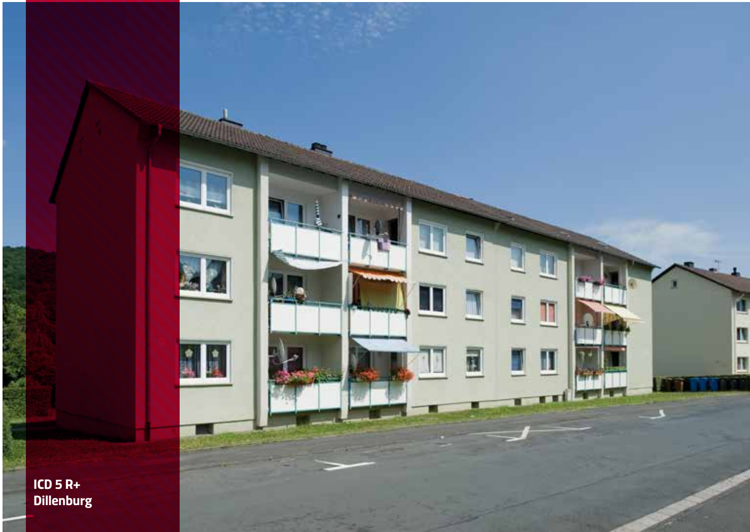
ICD 5 R+ Dillenburg