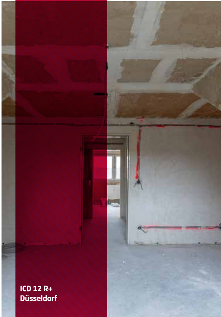
ICD 12 R+ Düsseldorf