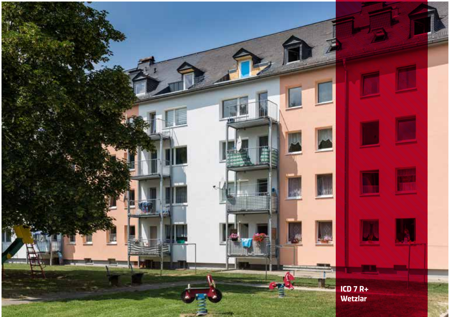
ICD 7 R+ Wetzlar